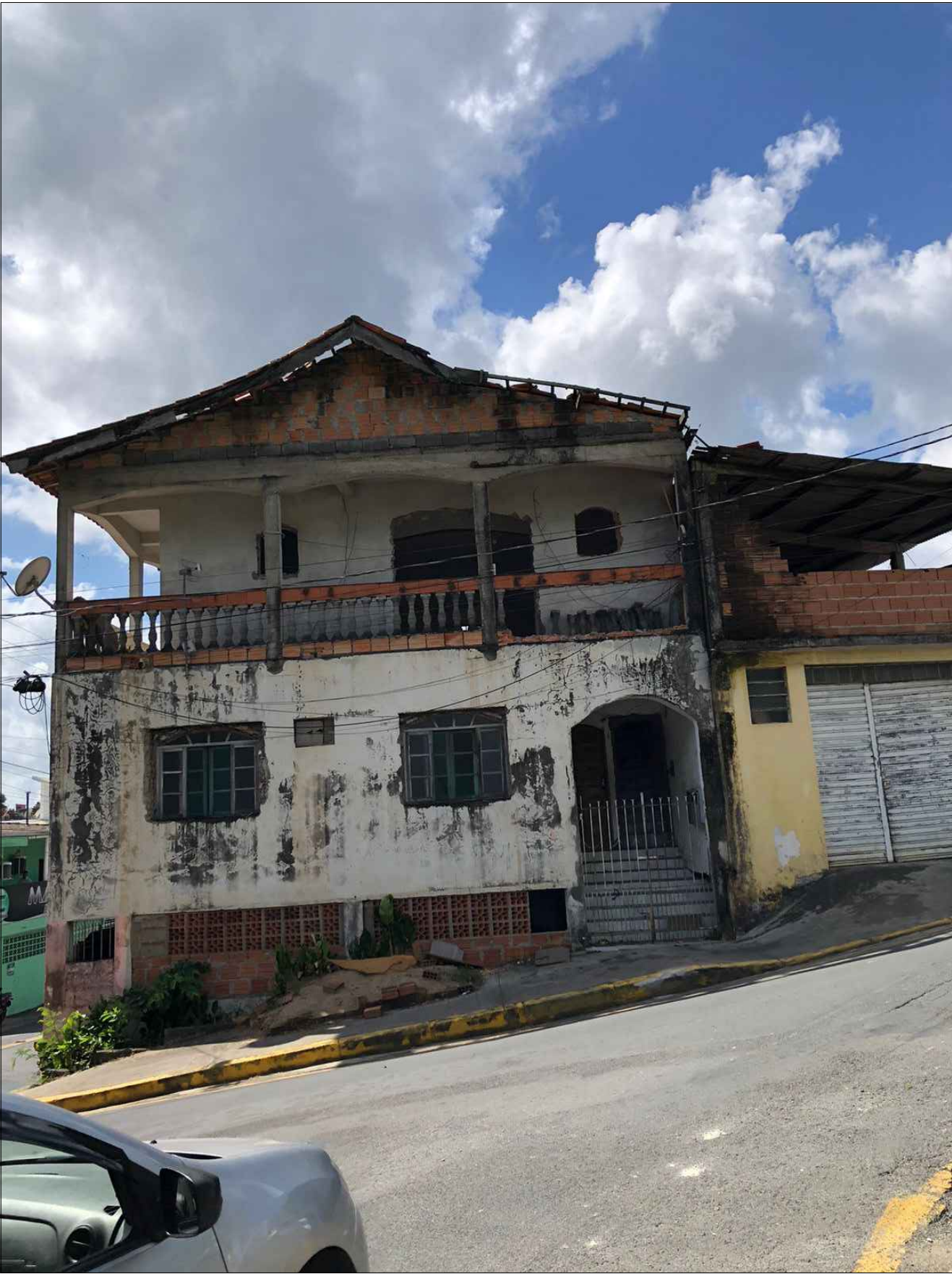
IMAGEM DA FACHADA FRONTAL