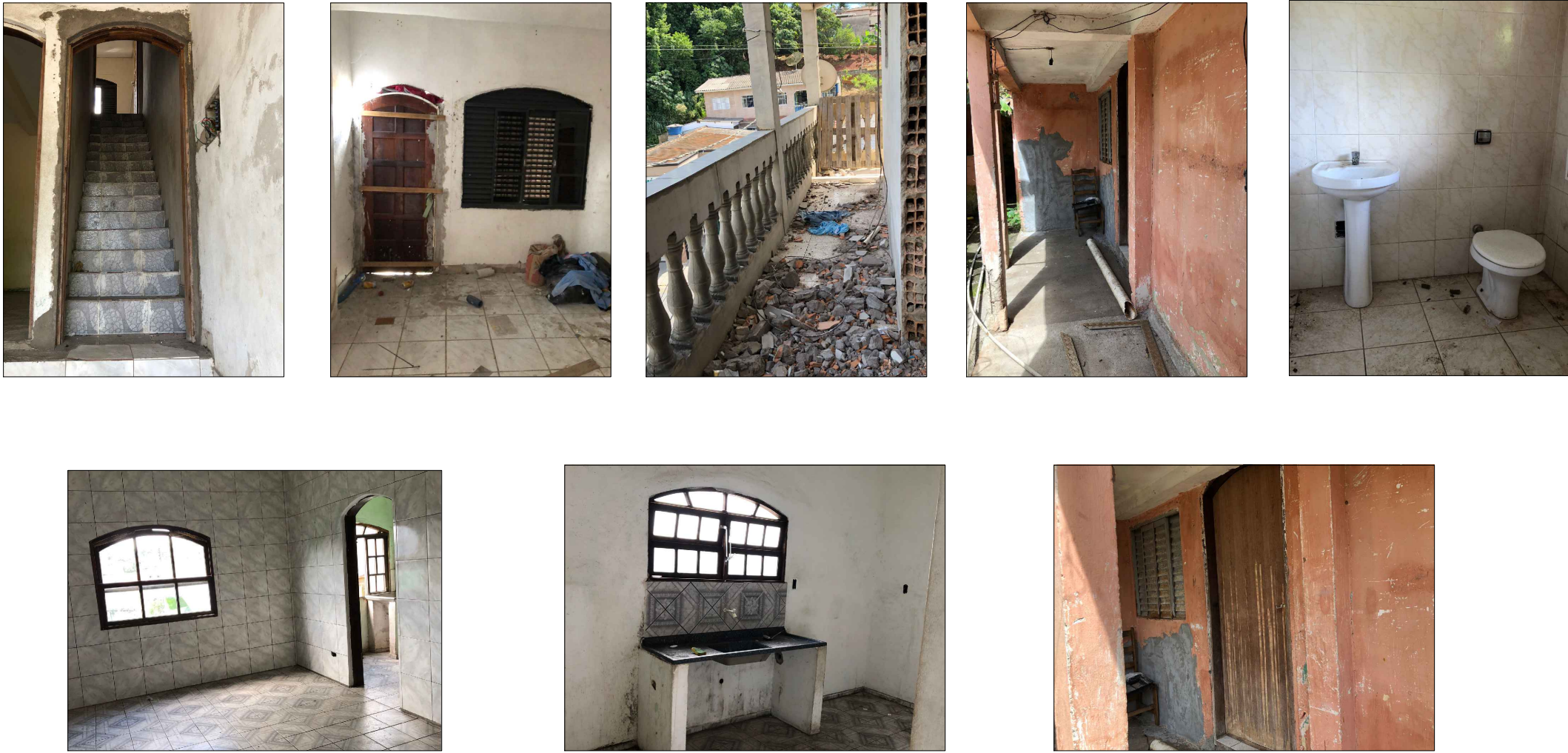
IMAGEM INTERNAS DA EDIFICAÇÃO