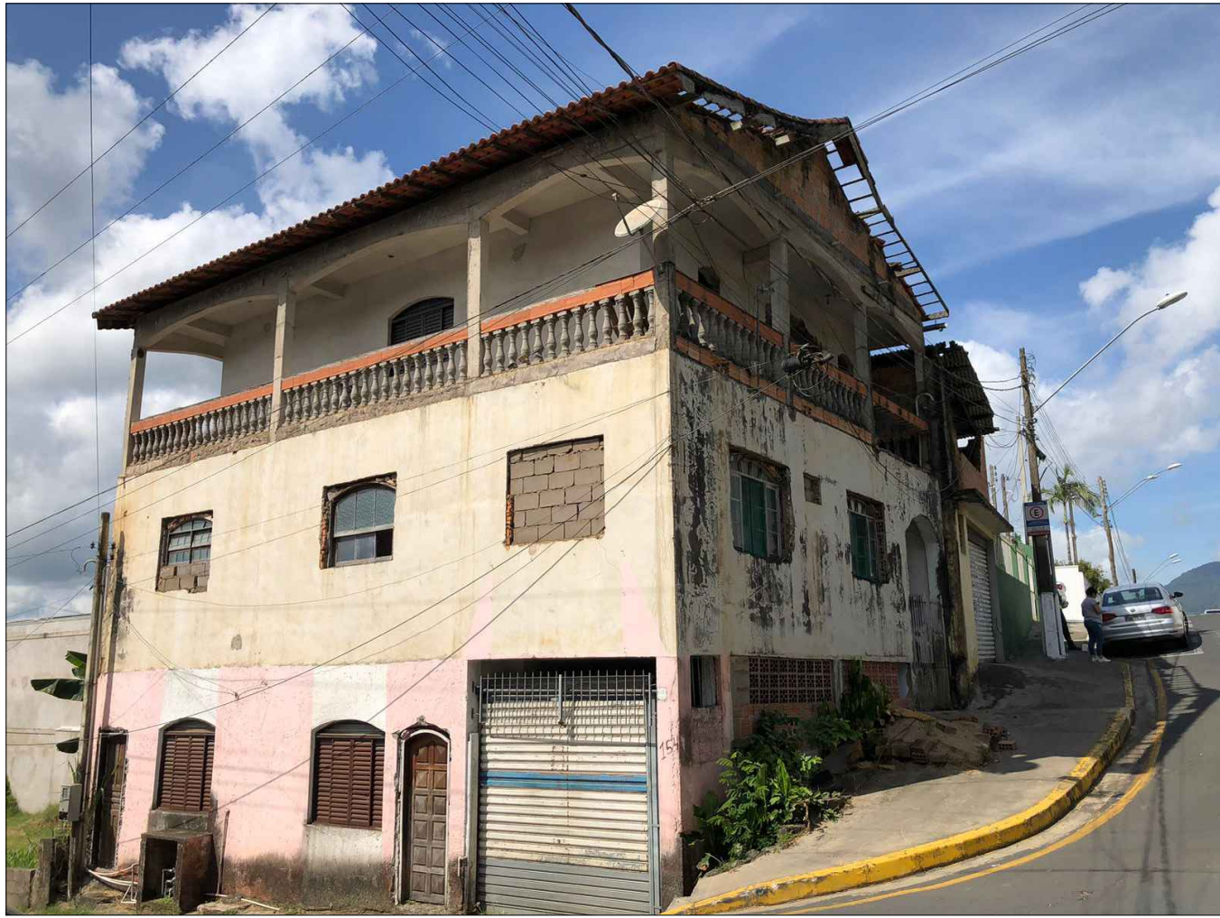
IMAGEM DA FACHADA LATERAL